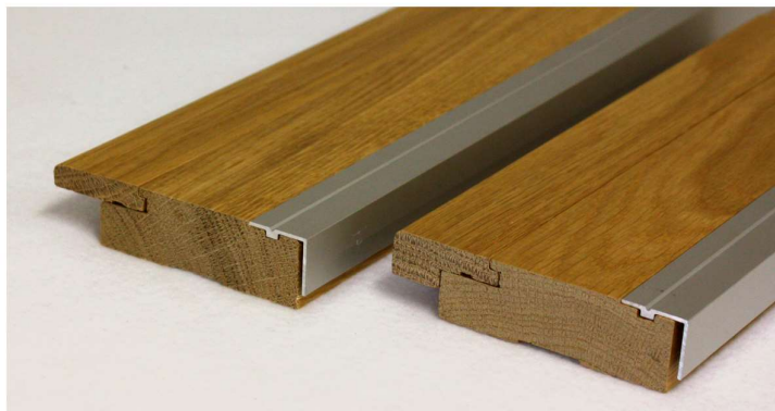
Vedeneristekynnys 23/15x92 parketille ja 23/8x92 laminaatille. Vedeneristekynnykset ovat tammea ja niitä on saatavana lakattuna tai valkolakattuna.

Classic Vedeneristekynnykset kylpyhuoneisiin ja märkätiloihin.